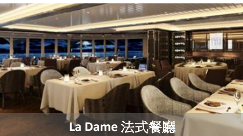
La Dame 法式餐廳