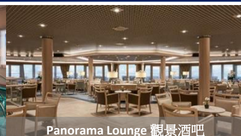
Panorama Lounge 觀景酒吧