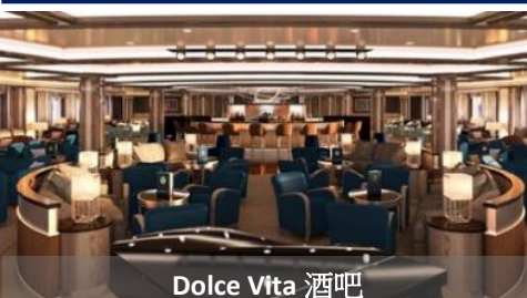
Dolce Vita 酒吧