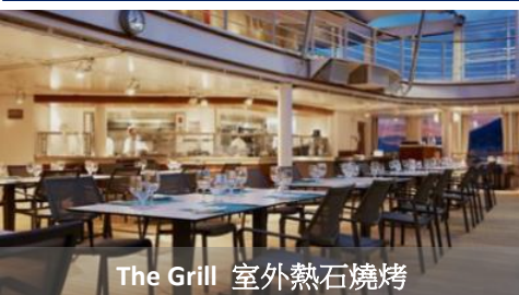
The Grill 室外熱石燒烤