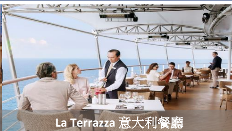
La Terrazza 意大利餐廳