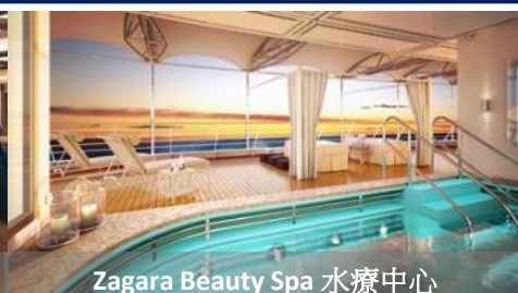
Zagara Beauty Spa 水療中心